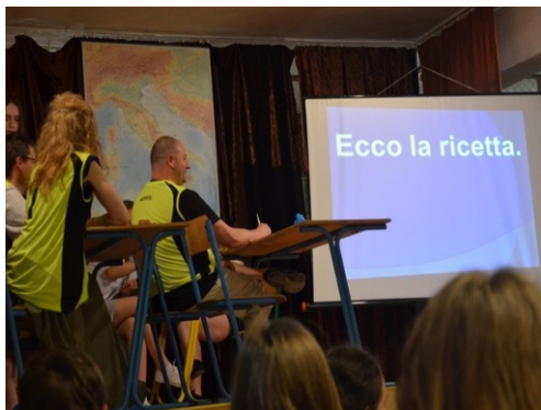
Co roku organizowany jest „Dzień włoski”, który ma na celu propagowanie włoskiego języka i kultury. Na zdjęciu – lekcja dla nauczycieli

Życie szkoły to nie tylko lekcje. Systematycznie organizujemy ciekawe imprezy, i festiwale, dzięki którym uczniowie ucząc się, bawiąc razem ze swoimi nauczycielami.