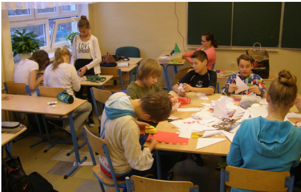
Zajęcia w ramach Festiwalu Nauki

W 2005 roku po raz pierwszy zorganizowany został - w formie warsztatów przedmiotowych -. Festiwal Nauki. Jego zadaniem było uświadomienie uczniom potrzeby posiadania wiedzy i wskazanie możliwości wykorzystania jej w praktyce. Festiwalowe hasło brzmiało: „Jestem Honorowym Obywatelą Mojej Małej Ojczyzny”. Od tego czasu Festiwal Nauki odbywa się co roku i jest imprezą, która cieszy się wśród uczniów ogromnym powodzeniem.