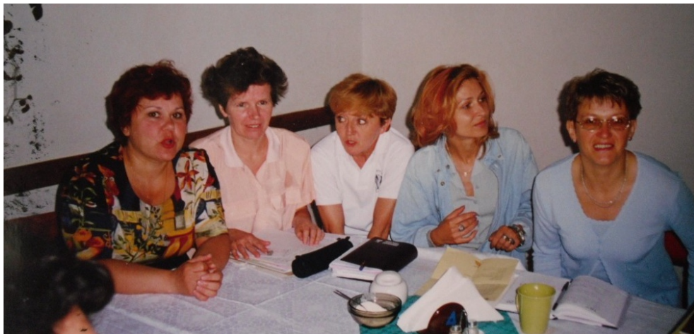
Grupa nauczycielek w czasie warsztatów Stowarzyszenia Szkół M.A.K.A.B.R.A.