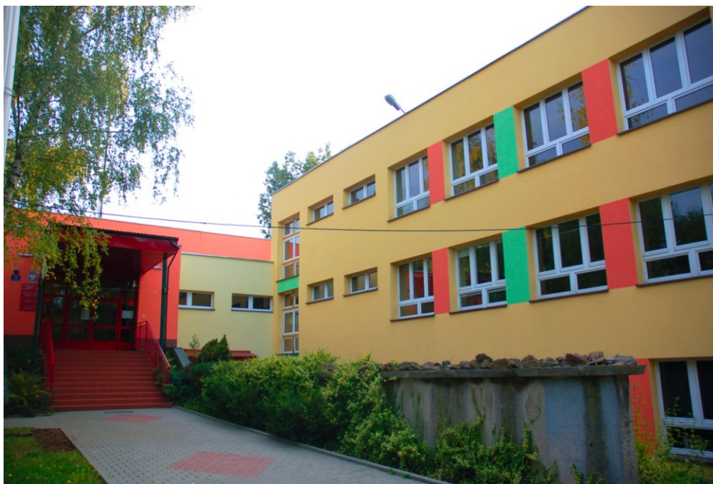
Wygląd budynku ZSOI 7 w 2015 r.

W centrum osiedla Wola Duchacka, między starymi, ocienionymi jodłami blokami przy ul. Czarnogórskiej a zupełnie nowymi budynkami mieszkalnymi przy ul. Włoskiej znajduje się niezwykła szkoła, która na stałe wpisała się w krajobraz dzielnicy.