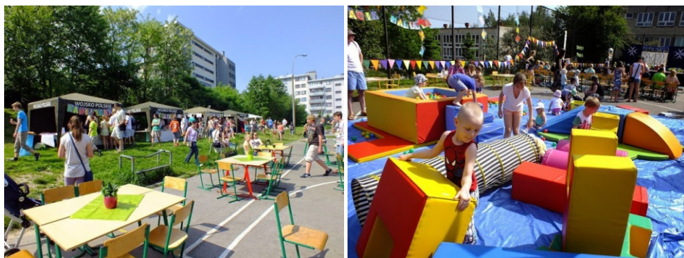
Zabawa w czasie Festynu Maltańskiego

Święto Szkoły, które obchodzimy co roku na wiosnę, zostało przekształcone w Festyn Maltański, który łączy całą lokalną społeczność – rodziny i znajomych naszych uczniów, mieszkańców osiedla i dzielnicy. Program Festynu staje się z roku na rok bogatszy i bardziej interesujący. Na scenie występują młodzi artyści, nie tylko z naszej szkoły. Wokół sceny ustawiają się kramiki, w których mali mieszkańcy osiedla mogą pomalować sobie twarze, samodzielnie zrobić biżuterię, zjeść zdrową przekąskę. Starsi i młodszy mogą także rozruszać się na stacjach sprawnościowych, a potem odpocząć w Kawiarence Maltańskiej.