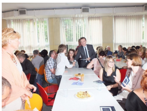
Dyrekcja szkoły i wychowawcy klas spotykają z rodzicami uczniów wpisanych do „Złotej Księgi”.