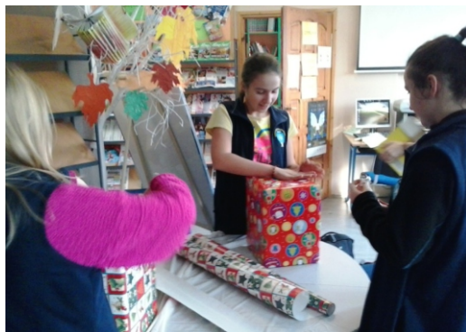
Przygotowanie „Szlachetnej Paczki”