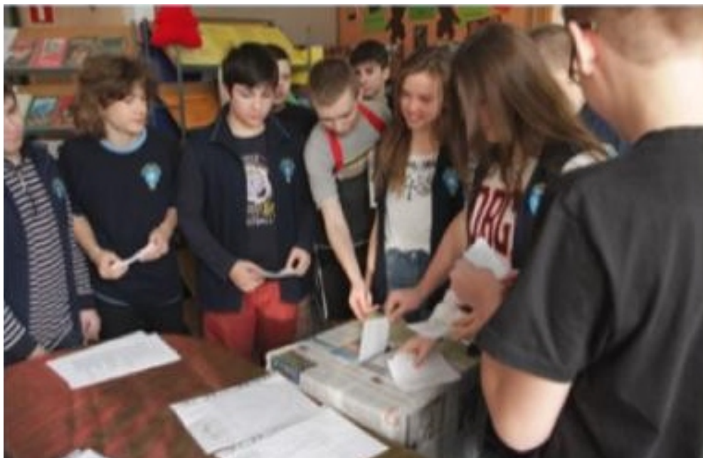
Książki, na które głosowali uczniowie, będą zakupione do biblioteki w roku szkolnym 2015/2016

Mamy nadzieję, iż uczniowie, nauczyciele oraz rodzice dzięki naszym staraniom doceniają znaczenie książek i czytelnictwa w rozwoju dziecka. Książka dostarcza drogowskazów. Dzięki niej dowiadujemy się : jak żyć, jak rozmawiać, jak się zachowywać i postępować, a także jak być przyzwoitym i prawym człowiekiem.