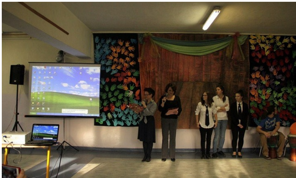
Uczymy się, bawiąc w czasie corocznych „Jarmarków twórczości”