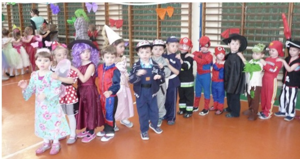
Przedkolaki bawią się w szkolnej sali gimnastycznej