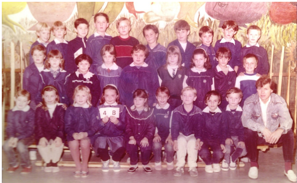
Oczywiście, w latach osiemdziesiątych obowiązywały „fartuszki” szkolne.