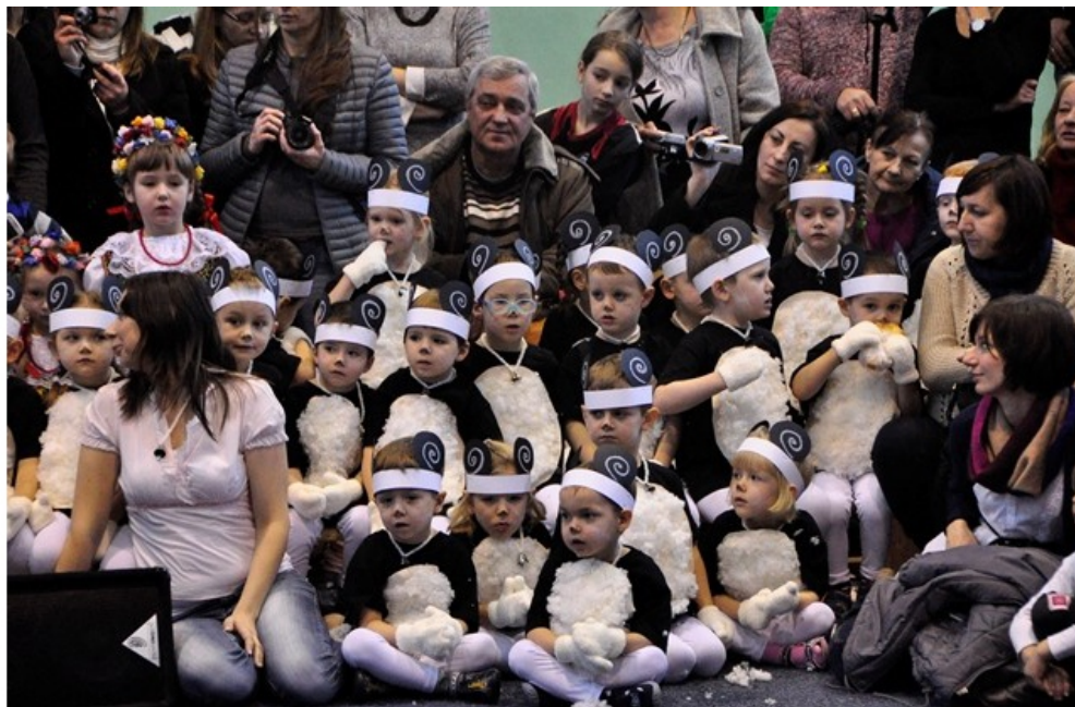
Przedkolaki szturmem zdobyły serca wszystkich pracowników i uczniów.

W roku 2012 w życiu naszej szkoły nastąpił przełom. 1 września do ZSOI nr 7 dołączyło Przedszkole Samorządowe nr 32 im. L.J. Kerna. Jesteśmy teraz niezwykłym zespołem, łączącym gimnazjum, szkołę podstawową i przedszkole.