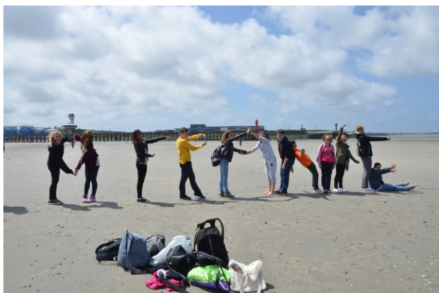
Nasi uczniowie na francuskiej plaży

W maju 2015 roku, to my przyjęliśmy uczniów z Francji. Oni, zachwyceni polską gościnnością i oczarowani Krakowem oraz innymi zakątkami Małopolski, z trudem rozstawali się z polskimi przyjaciółmi. Relacje nawiązane między młodzieżą z Polski i Francji stały się jeszcze silniejsze. Dzieci są w ciągłym kontakcie i pragną spotkać się jeszcze raz.