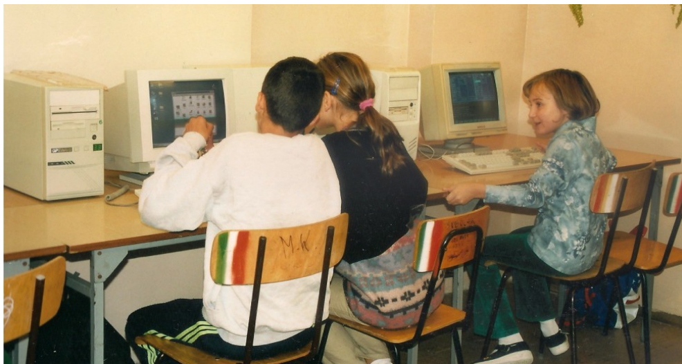
Pierwsza pracownia komputerowa szkoły