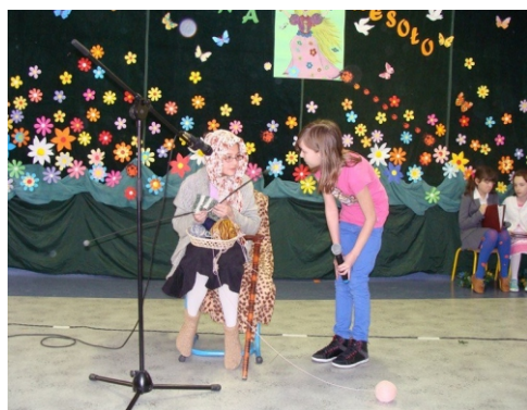
Wykorzystujemy każdą okazję (na przykład pierwszy dzień wiosny), żeby pogłębiać poczucie wspólnoty w czasie wspólnej zabawy.