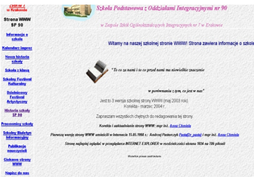
Pierwsza strona internetowa szkoły