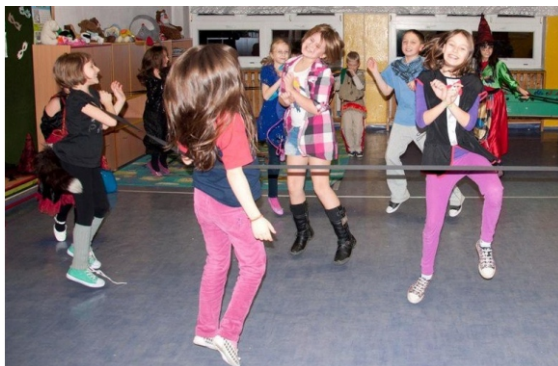
Zabawa karnawałowa w świetlicy