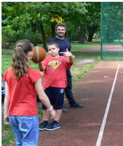
Zajęcia z pedagogiem to nie tylko „rozmowy gabinetowe”