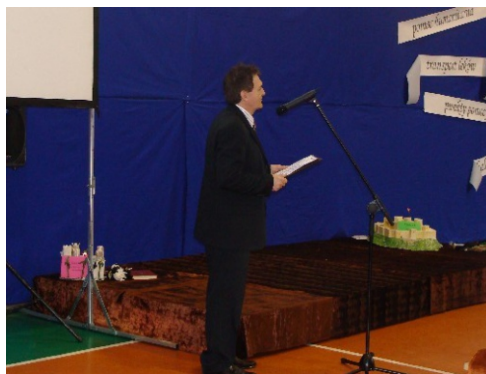
Uroczyste obchody nadania szkole imienia Polskich Kawalerów Maltańskich