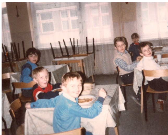
Stołówka szkolna w roku 1987

W drugim roku pracy warunki lokalowe szkoły znacznie się poprawiły. Powstała już sala gimnastyczna, stołówka, biblioteka. Rozpoczęły działalność koła zainteresowań, dzięki którym uczniowie mogli zdobywać wiedzę z interesujących ich dziedzin, rozwijać swoje zdolności i pasje.