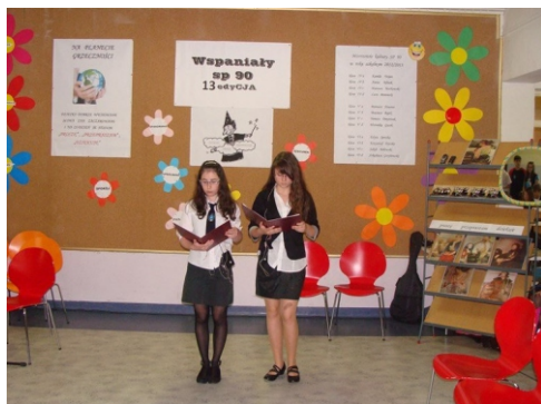
Już do 13 lat promujemy wśród uczniów zachowania, które są godne naśladowania, wybierając w każdej klasie „Wspaniałego”.