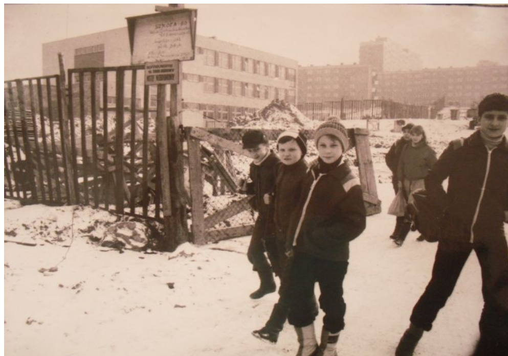
Uczniowie przed terenem szkoły w 1985r.