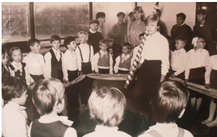
Uroczyste ślubowanie uczniów w 1985r.

Od pierwszych chwil działalności naszej szkoły jej pracownicy, nauczyciele i uczniowie tworzyli do dziś żywą tradycję. Przez trzydzieści lat, co roku uczniowie pierwszych klas uroczystie wkraczają w społeczność szkolną, składając ślubowanie.