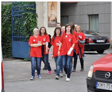
Udział wolontariuszy w grze miejskiej