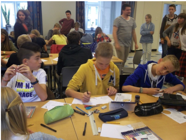
Praca w grupach polsko – belgijskich