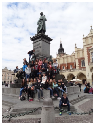
Goście z Francji z wizytą u wieszczka.

Wymiana uczniowska to coś więcej niż zwykła wycieczka. Jej podstawą jest spotkanie, zderzenie kultur, języków, mentalności, obyczajów, jak również odmiennego sposobu postrzegania świata i ludzi. Z taką sytuacją uczniowie często spotykają się po raz pierwszy w życiu. Jest to wartościowa okazja do uczenia się i zdobywania wiedzy nie tylko tej podręcznikowej, lecz przede wszystkim takiej, której sama szkoła nie przekaże. Spotkanie uczniów naszej szkoły z uczniami szkoły z Dunkierki tego właśnie dowodzi.