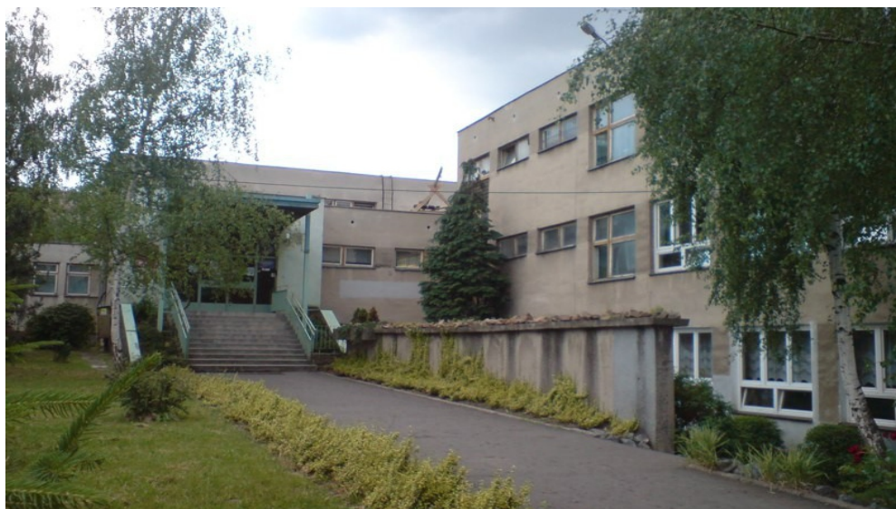
Wygląd szkoły w latach dziewięćdziesiątych