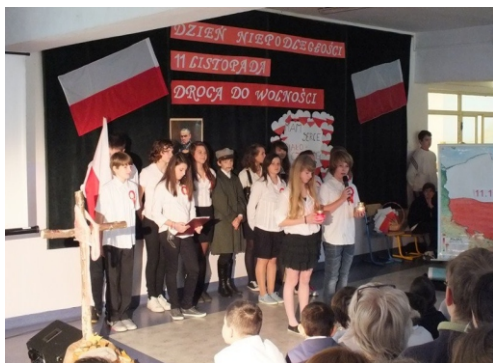
Uroczyste obchodzimy ważne dla naszego kraju rocznice.